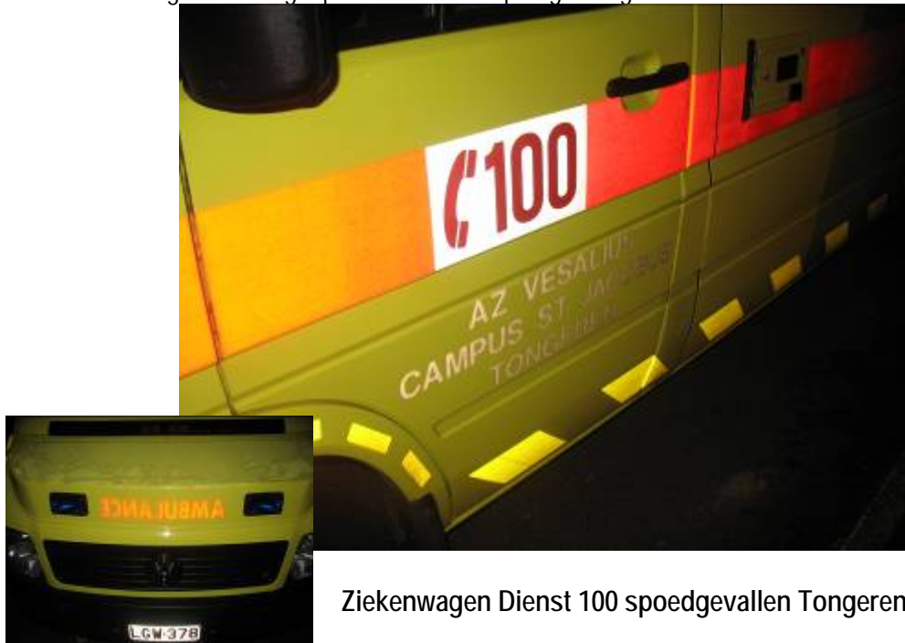
Ziekenwagen Dienst 100 spoedgevallen Tongeren

De ziekenwagenbemanning bestaat steeds uit een gespecialiseerde verpleegkundige en een ambulancier met 100-badge of twee gespecialiseerde verpleegkundigen.