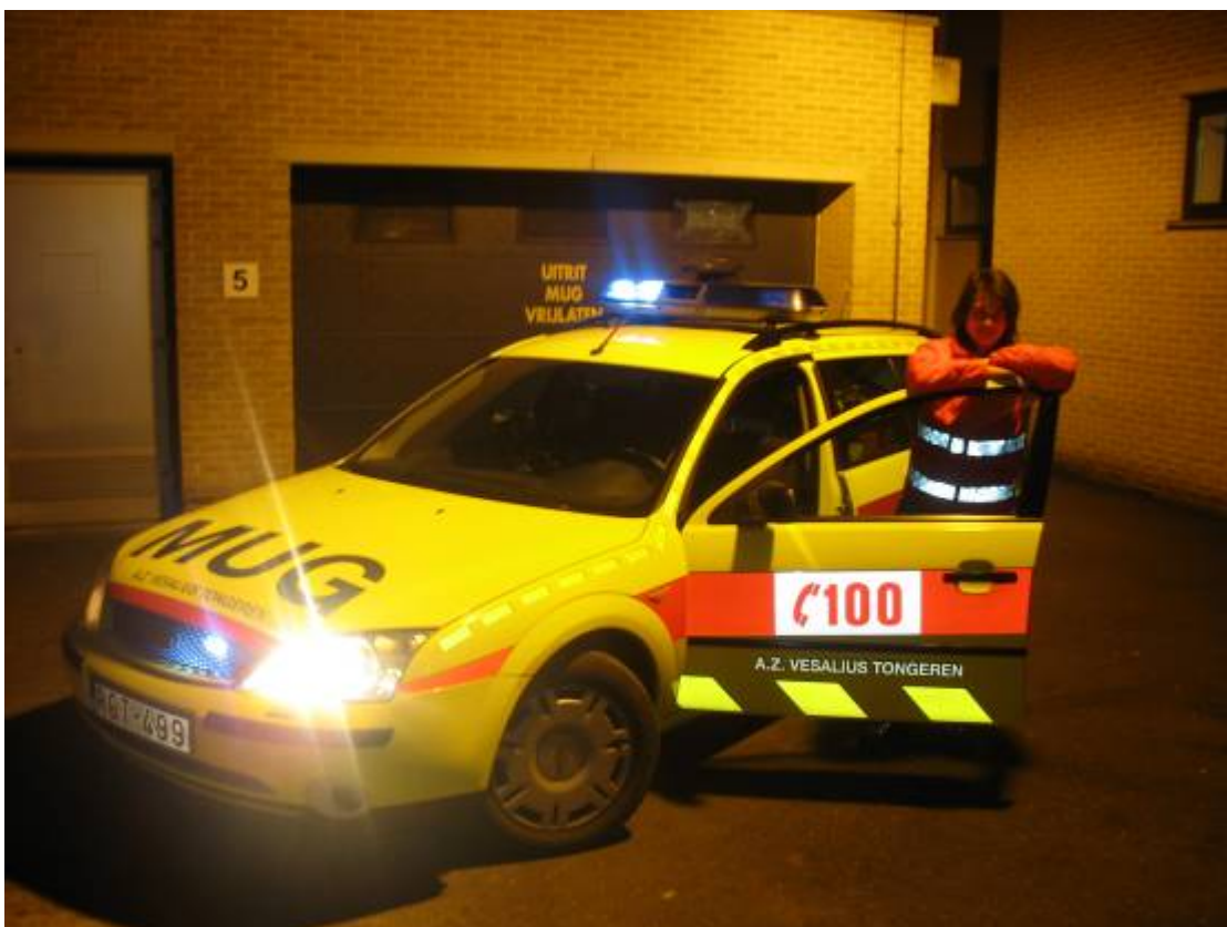
MUG-voertuig Ford Mondeo met verpleegkundige bijzondere beroepstitel

Dit team is permanent beschikbaar (24u op 24u). Zij zijn tevens verantwoordelijk voor de interne reanimaties binnen het ziekenhuis.