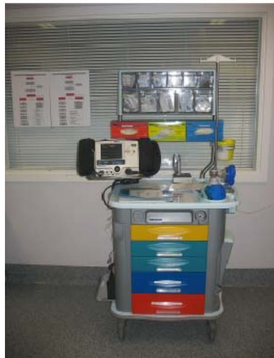
Reanimatiekar voor interne reanimaties, gestationeerd in reanimatiebox 1

De lijst met geneesheren van wacht worden dagelijks nagekeken door de nachtverpleegkundigen en afgeprint. Deze lijst is beschikbaar in het verpleegstation van spoedgevallen